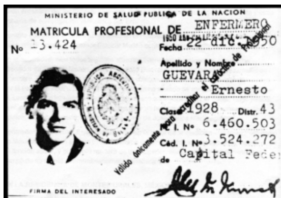
Figura 1. Credencial de Ernesto Guevara emitida por el Ministerio de Salud Pública de la Nación de Argentina.

Recibido: 2020-03-09 Aceptado: 2020-03-19 DOI: 10.29262/ram.v67i2.735