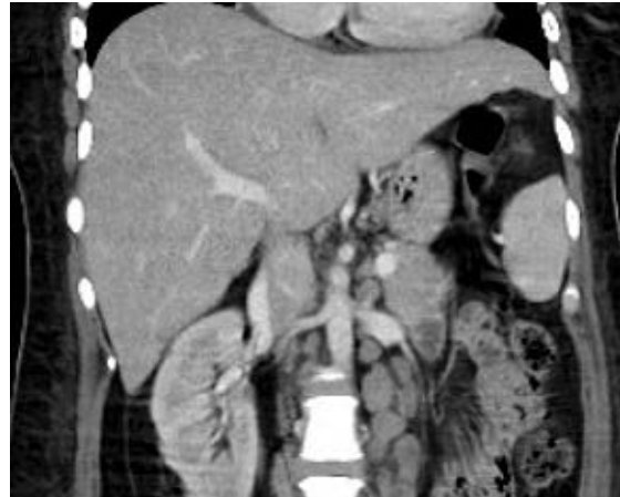
Figura 1. Tomografía axial computarizada toracoabdominal: aumento del tamaño del hígado, principalmente del lóbulo izquierdo; bazo con eje de 14 cm, hipodensidades mal delimitadas de entre 5 y 15 mm, múltiples crecimientos ganglionares en las cadenas paratraqueales inferiores bilaterales, precavales, paraaórticas y mesentéricas, con pérdida de la morfología del hilio graso.

Se descartó inmunodeficiencia primaria, enfermedades autoinmunes e infecciosas como tuberculosis y hongos. Se concluyó que se trataba de linfoma de Hodgkin clásico, variedad rica en linfocitos asociada a reactivación del virus de Epstein-Barr. Se inició tratamiento con inmunoglobulina y quimioterapia de rescate por alta carga tumoral, con respuesta poco favorable. La paciente presentó colestasis y datos de choque séptico asociado a neumonía nosocomial; falleció cuatro semanas después del ingreso hospitalario.